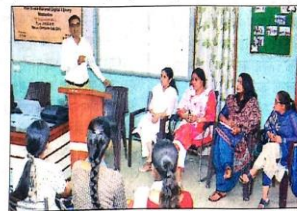
हिंदू कन्या महाविद्यालय में कार्यशाला को संबोधित करते हुए मुख्य वक्ता।