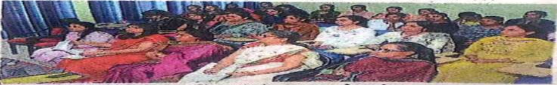
सेमिनार के दौरान हिंदू कॉलेज की छात्राएं और स्टाफ