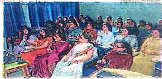
जी। हिन्दू कन्या महाविद्यालय में आयोजित सेमिनार में भाग लेते सदस्य।