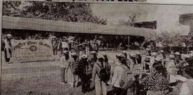
हिंदू कन्या महाविद्यालय में राष्ट्रीय एकता की शपथ लेते छात्राएं।