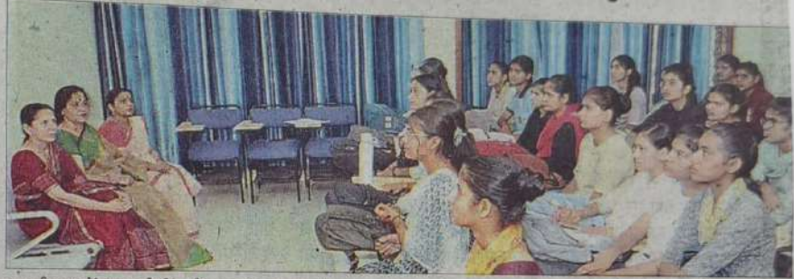
कार्यक्रम में भाग लेती हुई छात्राएं व स्टाफ।