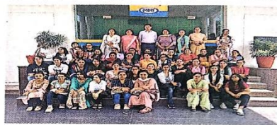
लक्ष्य प्लांट में भ्रमण करने पहुंची हिंदू कन्या कालेज की छात्राएं।